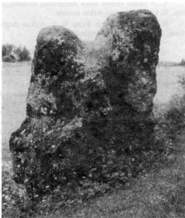
1. Antakmenės Aukų akmuo (1968 m. IIAS)

4. Unt[a]kmines lauki yra akmuo sulig pečių diduma, ir tas akmuo šlapias, niekad neišdžiūva. Nešdava apieras.