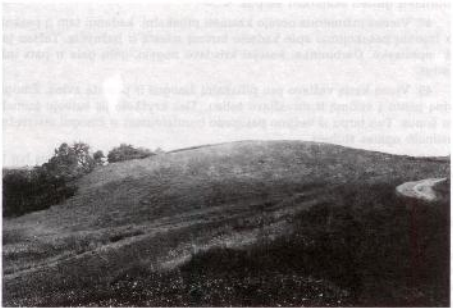
4. Lepšių Bobakalnis (1995 m.)

55. Tai ten bažnyčia buvus, susmegus po tuo kalnu, ten lygtai varpai skambindavo. Atseit tokios legendos, kad varpai girdisi.