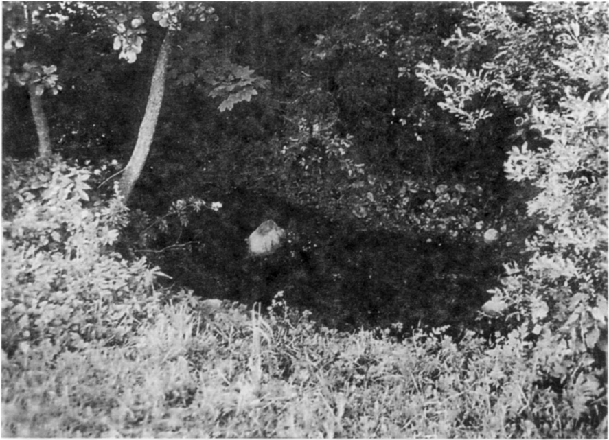
6. Paringys. Ringės upelio šventa vieta ir mitologinis akmuo (1995 m.)

(1) Tai į tą bažnyčią pirmiaus žmonės žmonės labai eidava, labai meldavav, vandenį iš tų nešdava, gydydava juom, prausdavav. <...>