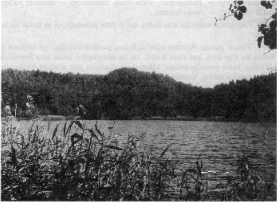
3. Mažulonių piliakalnis ir ežeras Vėlys (1995 m., V. Vaitkevičiaus nuotrauka)

33. Seniai seniai buva un ta kalna bažnyčia. Vienąkart žeme sudrebe[[j] pirmaj Velykų dienaj per mišių i bažnyčia pralekie žemesan, e tam daikti lika skyle, kurian linda tik maža vaika kūlakas. Kartų vaikas radis tų skylį ažužinklina akmeniukų, inmetie jan. Pa kiek laika užgirda bildesį – lyg geležinin sūdan kas stuktele. Un rytajaus rada tų akmeniukų prie skylei viršuj. Kas tik meta akmenį, tai vis grįžta.