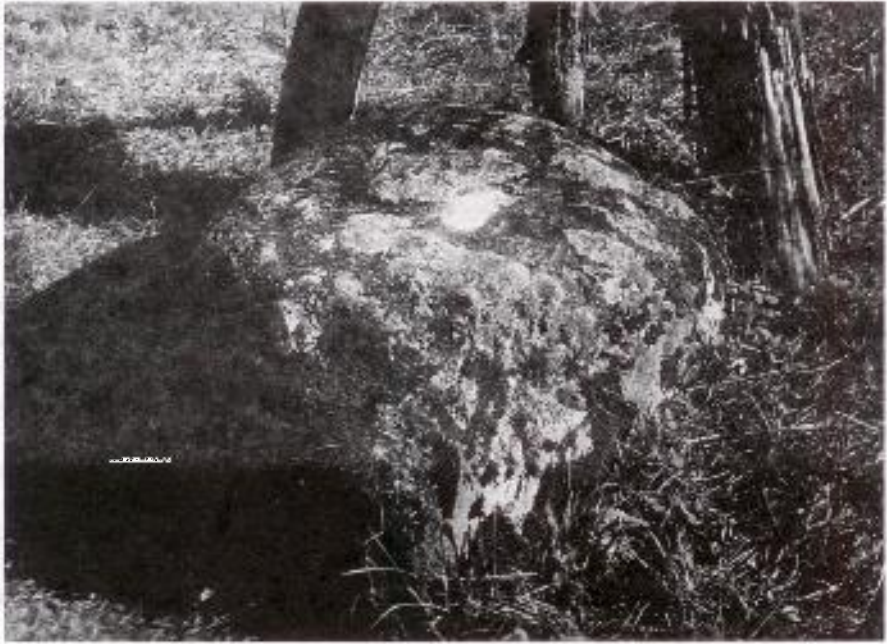
5. Čelniukų akmuo su Velnio pėda (1995 m.)

67. Netoli Latakiškės sodžiaus, Tverečiaus prp. miške yra akmuo didelis su žmogaus pėdu, visur vadinamas „Velnio pėdu“. Vieni sako, kad velnias nuo apušės šokęs ir įdaužęs koja. Sako, to akmens atskėlus, gerai karvėms ir kitoms ligoms.