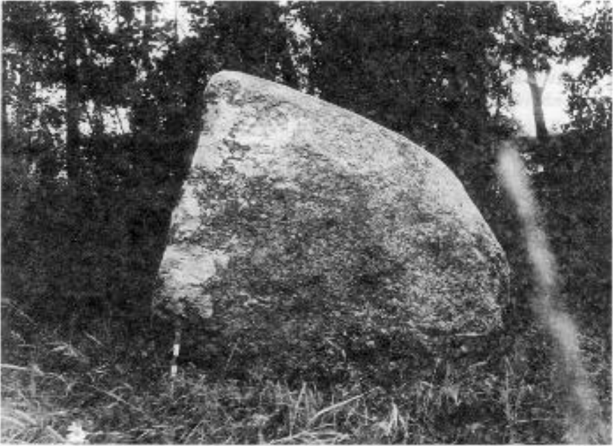
2. Kukoriškės akmuo Senovinis aukuras (1995 m., V. Vaitkevičiaus nuotrauka)

17. Kukoriškėj irgi buvo senybinis aukuras, būktai lygiai nuskeltas ir dvi duobelas. Buvo dirvoj, bet dabar viršum kajom apiverstas. Aukuras... Seni kaimynai pasakojo. Kai tą akmenį vertė, tai buvo apačioj akmeniokų pridėta irgi.