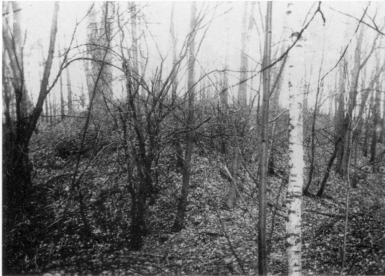
Perkūno kalnas. Kretingos r., Žalgirio apyl., Ėgliškių k.