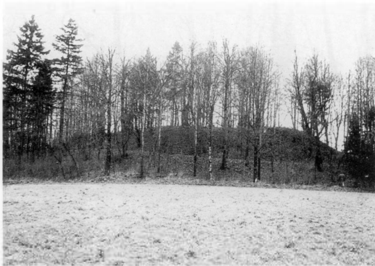
Perkūno kalnas. Švenčionių r., Cirkliščio apyl. ir k.