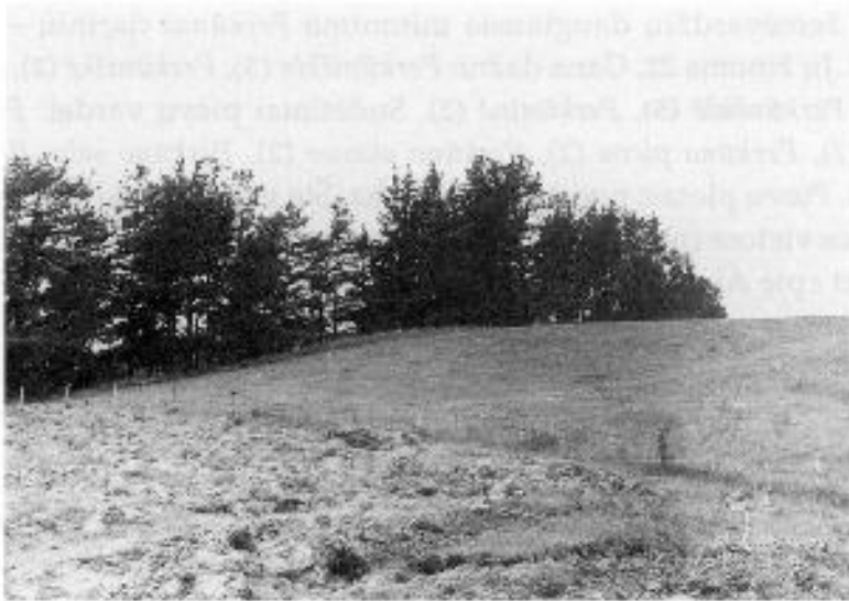
Perkūnkalnis. Alytaus r., Daugų apyl., Pocelionių k.