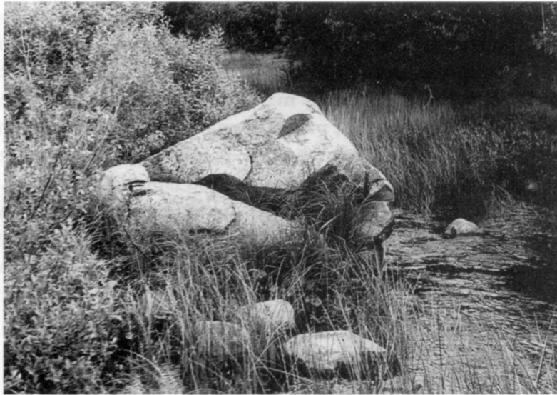
Perkūno akmuo Kruojos upelyje. Pakruojo r., Stačiūnų apyl., Kareiviškio k.

šitokių akmenų (ne visų dydžiai žinomi) – Perkūno akmuo , 4x3 m skersmens, rastas Varėnos r., Merkinės apyl., Puvočių kaime. Neįprastas akmens vardas: Perkūno skrynčia . Paaiškinama, kad akmuo yra skrynios formos. Išplėsti – trijų žodžių junginį sudarantys akmenų vardai: Perkūno skeltas akmuo , Perplyšęs Perkūno akmuo . Apie pirmąjį akmenį teigiama, kad jis guli Mūšos vagoje. Antrasis – Perplyšęs Perkūno akmuo – ypatingas tuo, kad, žmonių įsitikinimu, prie jo vaidendavosi: „Lauki – perplyšis perkūno akmuo. Kai tik sutemsta, kad ty gandina. Aš važiauvau sutemus, arklys net prigulys veža. Užsidegsiu liulku – pamačiau kaip nebe žmogus un burnos“ (LTR 3867/50/).