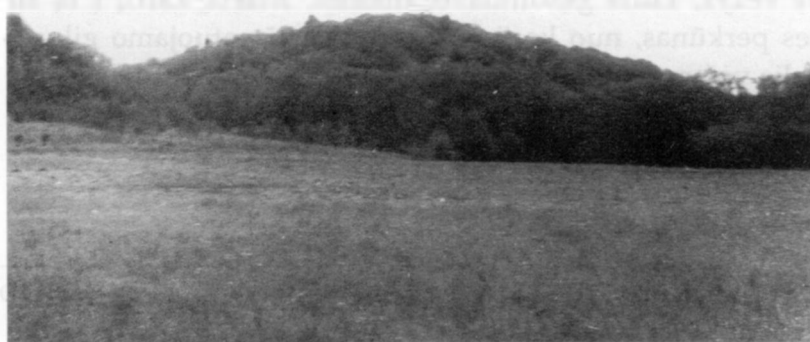
Perkūnkalnis Dubysos slėnyje. Raseinių r., Betygalos apyl., Pakalniškių k.